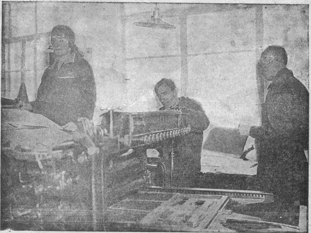
Робітники харківської друкарні „Інвалід-друкар“ відмовилися друкувати релігійну літературу, а антирелігійну літературу друкують у першу чергу